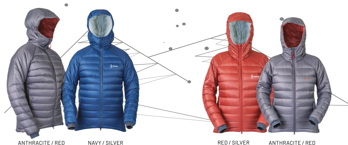
ANTHRACITE / RED

URČENÍ: celoroční | -5°C SVRCHNÍ MATERIÁL: Toray™ Airtastic™ DWR (100% recyklovaný nylon) VNITŘNÍ MATERIÁL: Pertex™ Quantum™ DWR (100% recyklovaný nylon) IZOLAČNÍ NÁPLŇ: 75 g evropské husí peří 90/10, 850 cuin, 65 g Climashield Eco 75 g/m CELKOVÁ HMOTNOST: Man (M) 400 g | Lady (S) 340 g VELIKOSTI: Man: S, M, L, XL, XXL. Lady: XS, S, M, L.